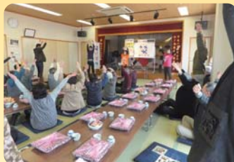
四国中央笑いヨガボランティア