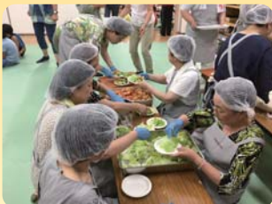
川之江ともしびの会