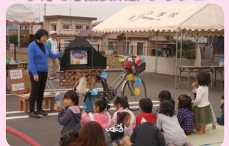
園児対象とした 紙芝居や絵本の読み聞かせ