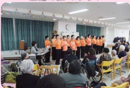
高齢者施設に慰問