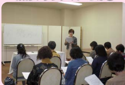
傾聴ボランティア スキルアップ研修会