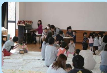
親子で楽しめるワークショップの様子（0歳児～3歳児対象）