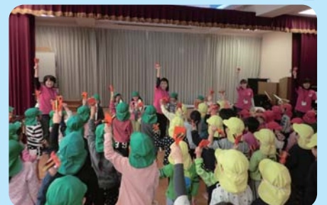
園児をを対象としたミニコンサート