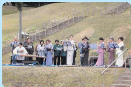
野外研修高齢者の集いの様子