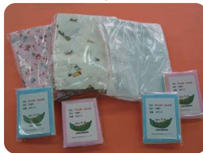
不織布「アレにも・コレにも」 各種ウエス