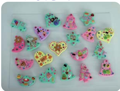
手づくりマグネット